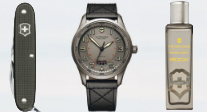
PIIONEER X DAMAST AIRBOSS MECHANICAL SWISS ARMY ROCK