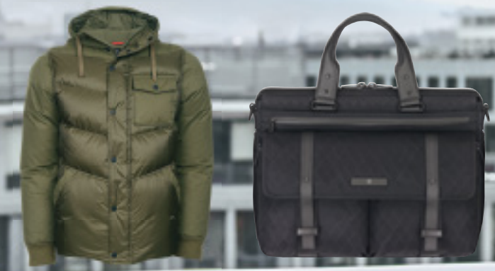
MILL DOWN PARKA ARCHITECTURE URBAN