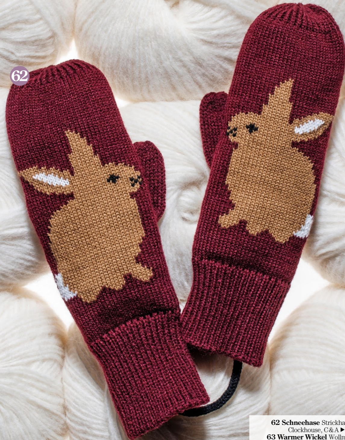
62 Schneehase Strickhandschuhe, Clockhouse, C & A ▶ CHF 9.-, 63 Warmer Wickel Wollmantel, Cos ▶ CHF 350.-, 64 Herzens-Schlüssel Vergoldetes Glückskettchen mit Anhänger, Manor ▶ CHF 79.90, 65 Magisches Trio 3er-Mini-Raumduftset «Oud», Carthusia, www.ausliebezumduft.ch, ca. ▶ CHF 115.-, 66 Sunshine-Reggea Sonnenbrille The Pristine, Viu ▶ CHF 215.-, 67 Süsses Bäumchen Tannenbaum aus Milch- und dunkler Schokolade mit Haselnuss-Gianduja-Füllung, Läderach ▶ CHF 4.40, 68 Klingeling! Leder-iPhone-Hülle, Maison Mollerus, Jelmoli, MCM-Shop ▶ CHF 160.-