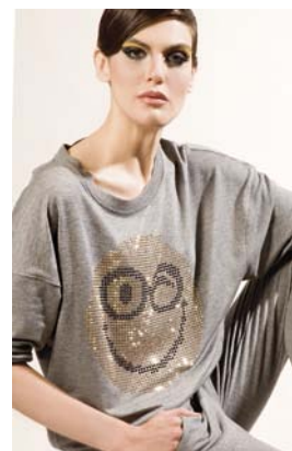
Textil-Revue Nr. 37, 13. Dezember 2013

Die Statement-Kette – ein Trend, der sich bei Jung und Alt durchsetzt. Vom konsumigen bis ins Premiumsegment, die tollen Ketten sind echte Eyecatcher.