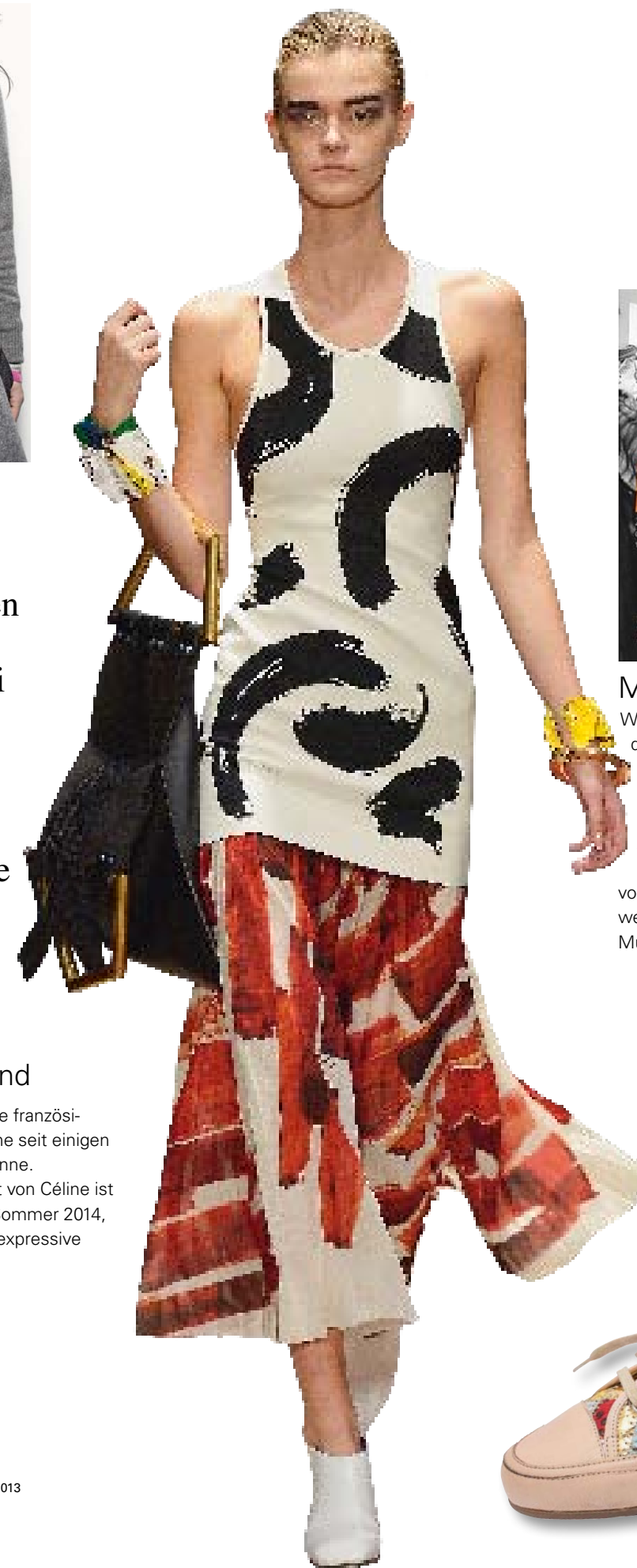
Textil-Revue Nr. 37, 13. Dezember 2013