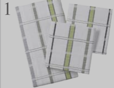
1 INS BETT FALLEN Mit dem karierten Bettbezug «Searsucker» aus 100 Prozent Bio-Baumwolle. Bei Manor. Kissen/Decke CHF 24.90/119.-

Wenige, dafür hochwertige Produkte kaufen ist im Trend. Kleine Kollektionen aus natürlichen oder wiederverwerteten Materialien sorgen für den individuellen Touch. Redaktion: Barbara Halter