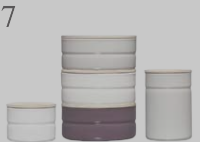
7 HÜBSCH GEORDNET Emaillie-Vorratsdosen von Riess, in vier Grössen und vier Farben erhältlich bei Gerolds Markt. www.editionpopulaire.ch , ab CHF 48.-

Der holländische Designer Piet Hein Eek macht Möbel aus dem, was andere entsorgen: Abfallholz, alte Metallplatten oder Fabrikschrott. Dementsprechend individuell sind seine Produkte. Bei seinem Sofa «Crisis Cushion» können Grösse, Farbe der Holzlackierung und Bezug selbst gewählt werden. Die Stoffe stammen meist aus Restbeständen von Kollektionen bekannter Textilproduzenten, die sonst weggeworfen würden. www.ecodesign-home.ch , ab CHF 3900.-