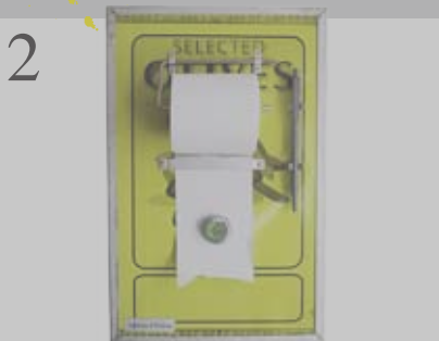
2 DAMIT NICHTS VERGESSEN GEHT Notizrollenhalter aus Olivenbüchsen. Produziert in einer sozialen Institution in Bern. Unikate. www.rafinesse-tristesse.com CHF 135.-