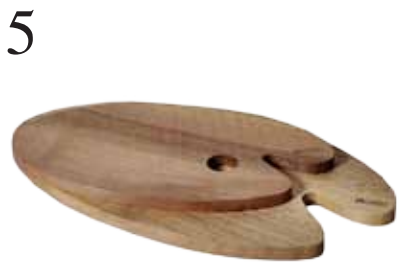
5 KÜCHENHELFER Schneidebrettchen von Ja und?, gefertigt in einer Behindertenwerkstätte in Graubünden. Bei Changemaker. CHF 29.-/36.-