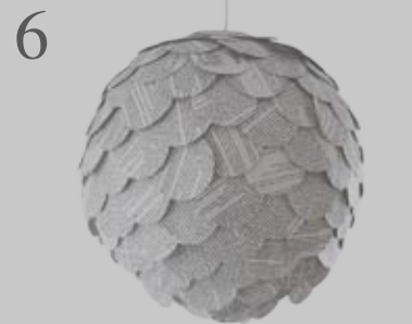
6 LICHTOBJEKT UND LAMPE Deckenleuchte aus recycelten Buchseiten. Individualisierbar. Produktsuche: 30295185. www.dawanda.com , ca. CHF 79.-