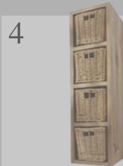
4 HUSCH INS KÖRBCHEIN Wandregal aus geöltem Nussbaumholz. Horizontal oder vertikal aufhängbar, 60 x 16 x 17,5 cm. www.vivanda-versand.ch CHF 99.90