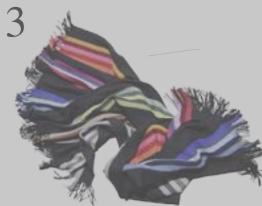
3 WARM EINKUSCHELN Gestreifte Decke der Textildesignerin Caroline Flueler. 100 Prozent Lammwolle, 200 x 130 cm. www.caroline-flueler.com CHF 390.-