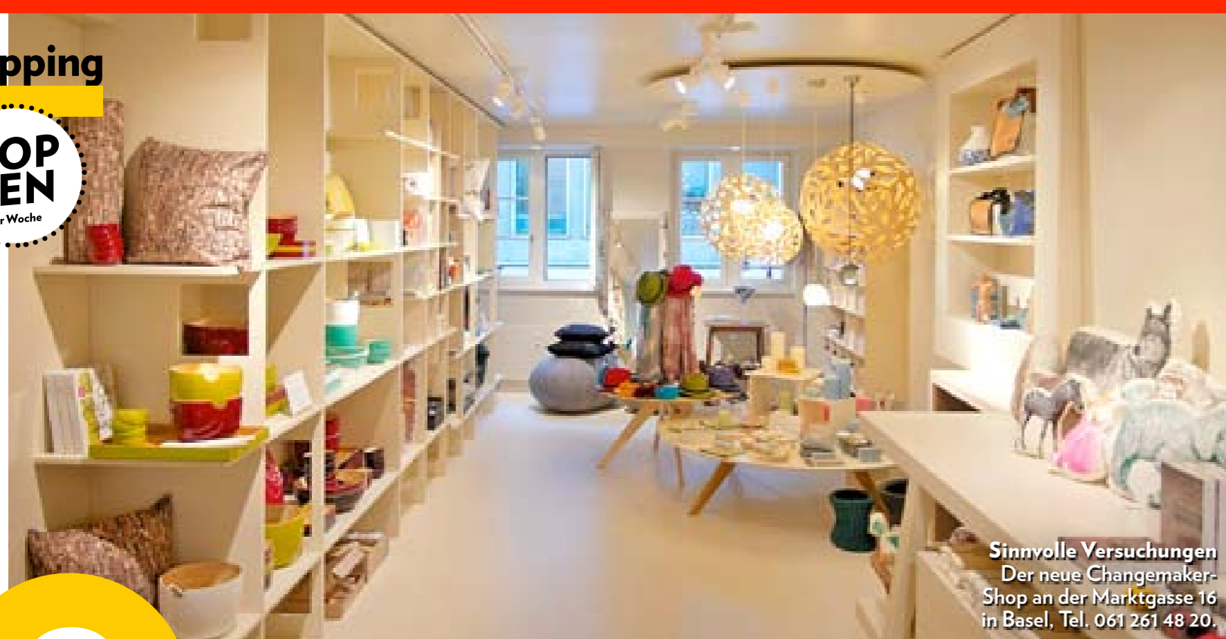
Sinnvolle Versuchungen Der neue Changemaker-Shop an der Marktgasse 16 in Basel, Tel. 061 261 48 20.