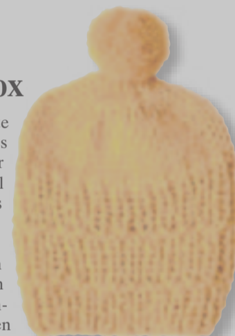
Mütze Box025 in verschiedenen Farben, pret-a-faire, mit Stricknadeln Fr. 60.–, ohne Stricknadeln Fr. 45.–, plus Versandkosten, www.pret-a-faire.ch