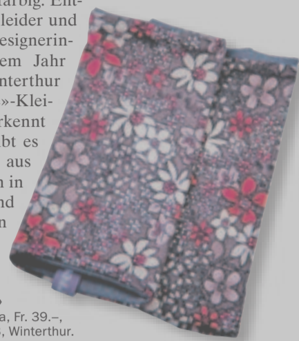
Armstulpen «Graue Blume» aussen gebümt, innen uni-fuchsia, Fr. 39.–, Glitzerfee-Laden, Wartstrasse 33, Winterthur, www.glitzerfee.ch