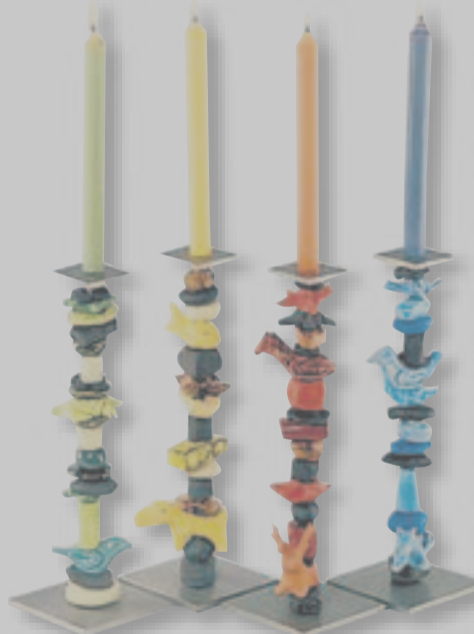
Abraka-Produkte Brühgut-Stiftung Winterthur, Kerzenständer, 18 cm: Fr. 71.–, 30 cm: Fr. 91.–, Flaschenverschluss einzeln: Fr. 15.–, Auskunft und Bestellung, Brühgut-Stiftung, Tel. 052 208 1382, www.bruehgutstiftung.ch

Kleine Enten, Vögel, Fische oder Seepferdchen: Die Tiere, die in der Keramikwerkstatt der Brühgut-Stiftung in Winterthur Töss entstehen, sind unverkennbar. Hergestellt werden sie von einem Handwerker, der voll und ganz in der Welt der Tiere aufgeht und alle Tiere kennt. Neben den Abraka-Kerzenständern, die mit Tieren und abstrakten Figuren gestaltet sind, gibt es Totems (mit grösseren Tieren) sowie Flaschenverschlüsse. Neu sind die Verschlüsse einzeln erhältlich.