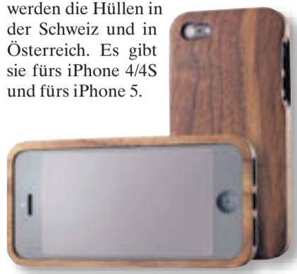
iPhone-Cover iDryad-Cover, Nuss, Fr. 89.–, Changemaker, Obertor 33, Winterthur, www.changemaker.ch

So wie jeder Baum einzigartig ist, so ist jedes «iDryad»-Cover ein Einzelstück. Nach griechischer Mythologie ist Dryade eine Nymphe, deren Schicksal untrennbar mit jenem des Baumes verbunden ist. Sie verkörpert die Seele eines Baumes. «iDryad»-Hüllen sind aus Vollholz. Sie unterscheiden sich nicht nur im Holz, sondern auch in der Masierung. Die Marke «iDryad» aus Biel will ganz bewusst einen Kontrapunkt setzen zu all den Produkten aus Plastik. Das Holz – Nuss-, Kirsch- oder Birnbaum – stammt aus nachhaltig bewirtschafteten Wäldern des Alpenraums. Hergestellt werden die Hüllen in der Schweiz und in Österreich. Es gibt sie fürs iPhone 4/4S und fürs iPhone 5.