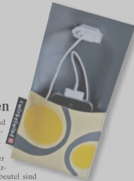
Handy-Aufladebeutel wirbelwind, zwischen Fr. 26.– und Fr. 36.– (je nach Anzahl Teilen), plus Versandkosten, erhältlich bei: wirbelwind, Tel. 079 221 96 33, www.wirbelwind.ch