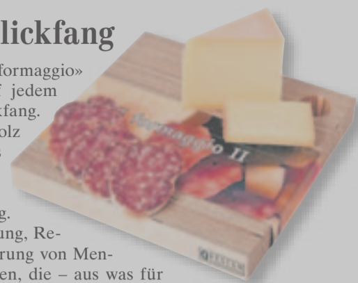
Schneidebrett Il formaggio II Quellenhof-Stiftung, 23x23 cm, Fr. 37.–, Q-Design-Laden, Barbara-Reinhart-Strasse, Winterthur, www.shop.qhs.ch Schön und Buch, Steinberggasse 52, Winterthur, www.schoen-und-buch.ch

Das dekorative Schneidebrett «Il formaggio» ist von Hand gemacht und auf jedem Tisch ein ganz besonderer Blickfang. Das Brett ist aus Birkenperspexholz und eignet sich auch sehr gut als Servierbrett. Hergestellt wird das Schneidebrett in der geschützten Werkstatt der Quellenhof-Stiftung. Sie engagiert sich für die Begleitung, Rehabilitation und Wiedereingliederung von Menschen verschiedener Altersgruppen, die – aus was für Gründen auch immer – am Rande der Gesellschaft stehen. Die Herstellung von Eigenprodukten an geschützten Arbeitsplätzen eröffnet ihnen die Chance auf soziale und wirtschaftliche Eingliederung. Gleichzeitig fertigen sie von Hand hochwertige Schweizer Designprodukte an.