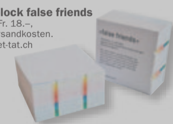
Notizblock false friends tät-tat, Fr. 18.–, plus Versandkosten, www.taet-tat.ch