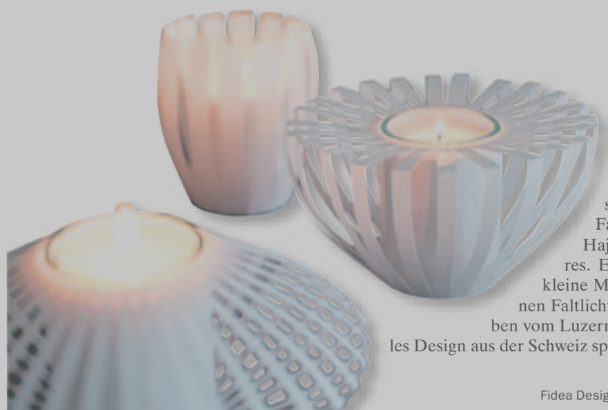
Faltlichter 1 bis 3 Fidea Design, Fr. 25.–, Kaufkaffee, Tösstalstrasse 8, Winterthur, www.fideadesign.com