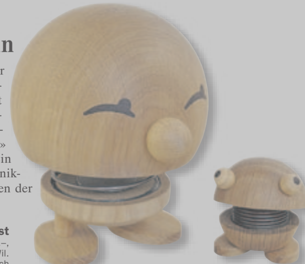
Eichenholzmännchen hoptimist 6 cm hoch: Fr. 37.–, 12 cm hoch: Fr. 82.–, Heimstätten Wil, Marktstrasse 55, Wil, www.present.ch

Er ist klein, passt überall hin und er ist nicht nur etwas für Kinder: Der «hoptimist» zaubert immer wieder ein Lächeln aufs Gesicht. Drückt man auf das kleine Männchen und sein Eichenholzköpfchen, hüpfet es fröhlich mit beiden Beinen in die Luft. Hergestellt wird der «hoptimist» in einer geschützten Werkstatt in Dänemark. Ein Teil des Verkaufserlöses geht an dänische Klinikclowns. In der Schweiz kann man ihn im Laden der Heimstätten Wil oder übers Internet kaufen.