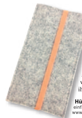
Hülle für iPhone 5 einfachFilz, Fr. 39.–, Changemaker, Obertor 33, Winterthur, www.changemaker.ch

Die iPhone-Hüllen vom Atelier «einfachFilz» sind von Hand gefertigt und 100 Prozent swiss made. Eine Zugreise nach Bern, Langeweile im Büroalltag und die Erinnerungen an Filzpantoffeln aus der Kindheit brachten André Keller auf die Idee von «einfachFilz». Heute gibt es diverse Designprodukte aus Wollfilz sowie Meterware in allen Farben und Dicken. Die iPhone-Hüllen werden in Zusammenarbeit mit der Schneiderei Strafanstalt Pöschwies genäht. Die Insassen werden von den Mitarbeitern des Ateliers angeleitet, die Werkstatt bietet ihnen damit eine sinnvolle Beschäftigung im Strafvollzug.