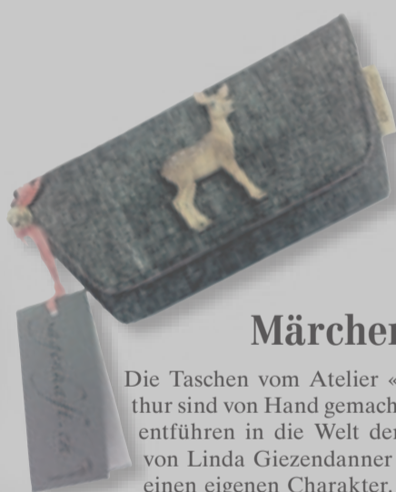
Handtaschen «Jagdfeber» Artur, Fr. 98.–, kleinere Taschen ab Fr. 69.–, Atelier sagenhaft, Wiesenstrasse 3, Winterthur, www.sagenhaft.ch